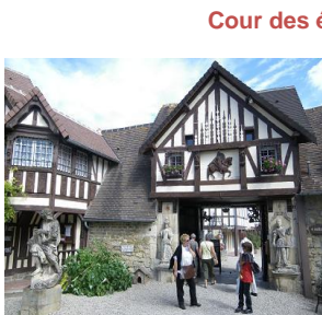
Cour des évangélistes